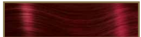
ROSSO SCURO / DARK RED