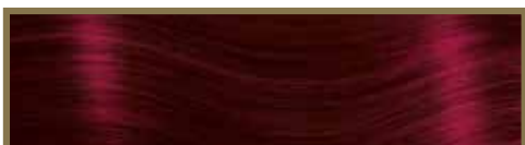
BORDEAUX / BORDEAUX