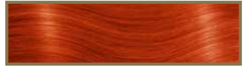
ARANCIONE SCURO / DARK ORANGE