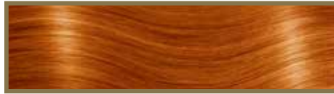
ARANCIONE / ORANGE