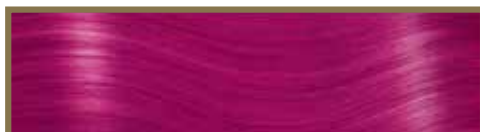
FUCSIA SCURO / DARK FUCHSIA