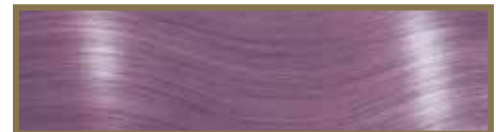
LILLA / LILAC