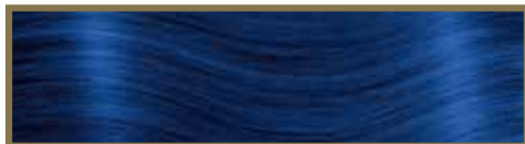
BLU / BLUE