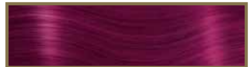
VIOLA ROSSASTRO / REDDISH VIOLET