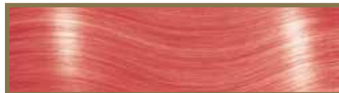
ROSA SCURO / DARK PINK