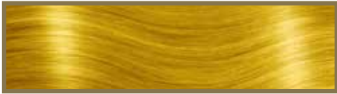
GIALLO / YELLOW