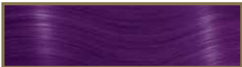
NUOVO VIOLA / NEW PURPLE