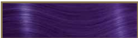
VIOLA SCURO / PURPLE