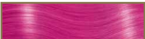
FUCSIA / FUCHSIA