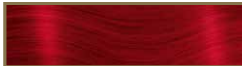
ROSSO / RED