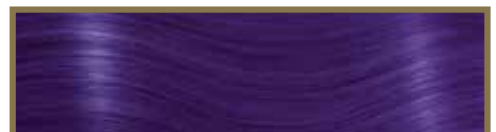
VIOLA / VIOLET