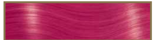
ROSA / PURPUREO PURPLISH PINK