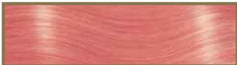
ROSA / PINK