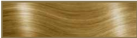
ORO / GOLD